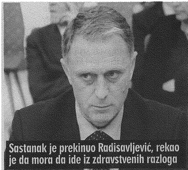
Sastanak je prekinuo Radisavljević, rekao je da mora da ide iz zdravstvenih razloga

Na sastanku u Tužilaštvu SBPOK dostavio izveštaj sa spiskom na čijem je čelu bio ministar zdravlja. Inspektor Radević je pustio i prisluškovane telefonske razgovore osumnjičenih.